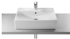
Lavabo de porcelana de sobre encimera 32711G..0