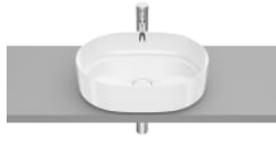
ROUND - Lavabo de FINECERAMIC® de sobre encimera