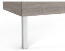
Conjunto de dos patas opcionales 816829339