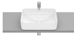
SQUARE - Lavabo de FINECERAMIC® de sobre encimera