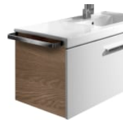
Toallero lateral para mueble