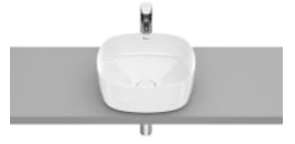
SOFT - Lavabo de FINECERAMIC® de sobre encimera