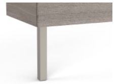
Conjunto de dos patas opcionales 816829458