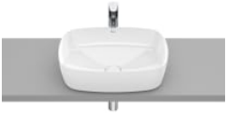
SOFT - Lavabo de FINECERAMIC® de sobre encimera